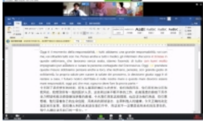
图为学生小组讨论新闻内容

此外,周老师还让学生化身“新闻评论人”,以手中新闻素材为例,尝试从文化视角解读意大利疫情新闻背后的社会文化因素。“从这篇意媒报道中我看到了意大利文化基因中的个人表达意识非常强烈”“通过这个报道我发现意大利官方语言表达中大多使用的是‘倒金字塔’结构,且多用条件式这类的委婉语”……围绕搜集的新闻素材,同学们在课堂上热烈讨论着新闻里的文化故事。